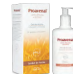
GEL DE DUCHA